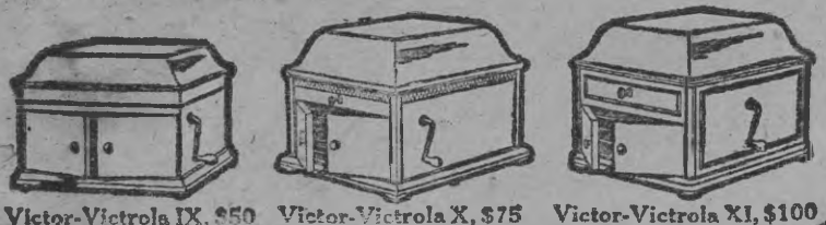
Victor-Victrola IX, $50 Victor-Victrola X, $75 Victor-Victrola XI, $100

"LA POSTAL" FRONTING SANTA ANA PLAZA, PANAMA.