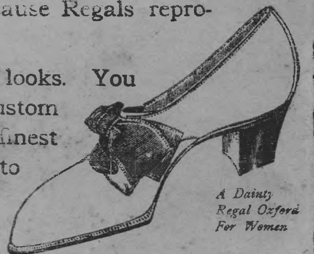
A Dainty Regal Oxford For Women