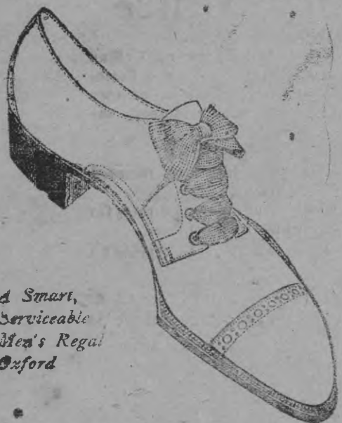
A Smart, Serviceable Men's Regal Oxford