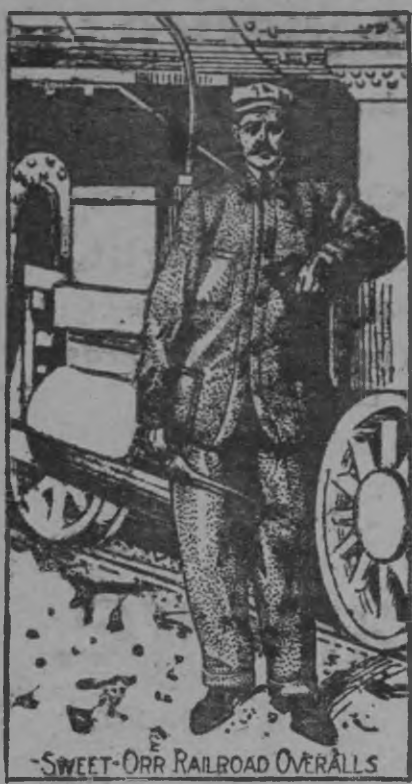
SWEET-ORR RAILROAD OVERALLS